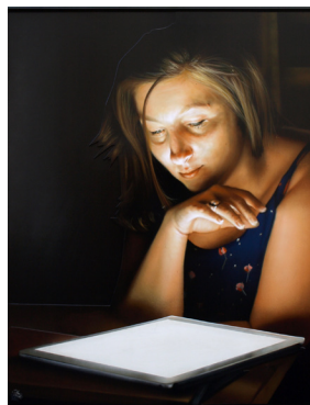
Emails , 2018 Bombe de peinture sur médium. 160 x 130 cm 3 500 euros