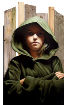
Hold On , 2018 Bois, bombe de peinture sur médium. 160 x 100 cm 3 200 euros