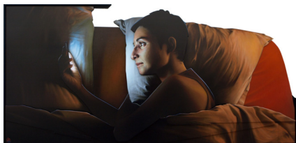
The Message , 2018 Bombe de peinture sur bois et médium. 120 x 250 cm 6 000 euros