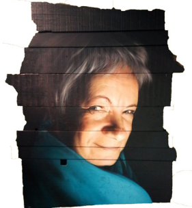
Motherboard , 2019 Bombe de peinture sur bois. 170 x 140 cm 4 000 euros