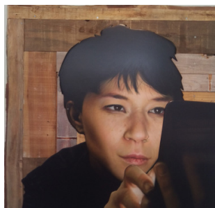
Gallery , 2019 Bois, bombe de peinture sur médium. 120 x 120 cm 3 200 euros