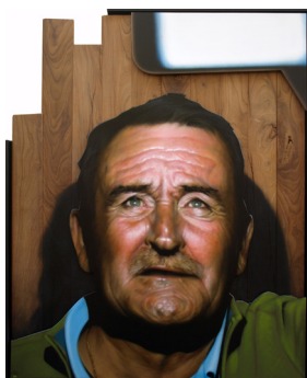
Selfie , 2018 Bois, bombe de peinture sur médium. 150 x 122 cm 3 200 euros