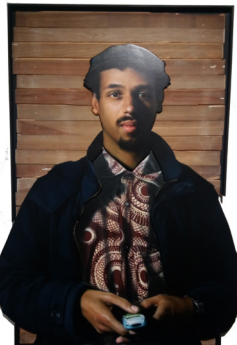
Snake II , 2019 Bois, bombe de peinture sur médium. 165 x 105 cm 3 500 euros