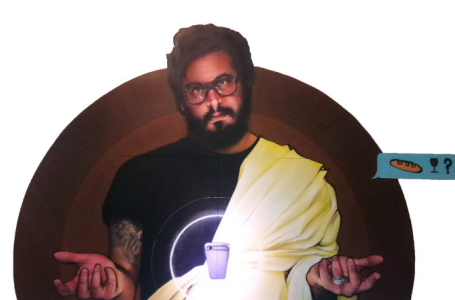
L'Avant-Cène , 2016 Bombe de peinture sur bois. 285 x 400 cm 2 800 euros