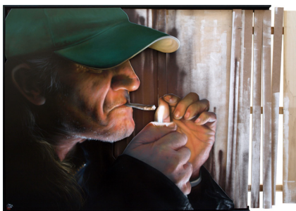
Minitel , 2018 Bois, bombe de peinture sur médium. 120 x 180 cm 4 000 euros