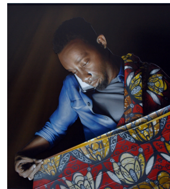
Order , 2018 Bombe de peinture sur bois et médium. 160 x 160 cm 4 000 euros