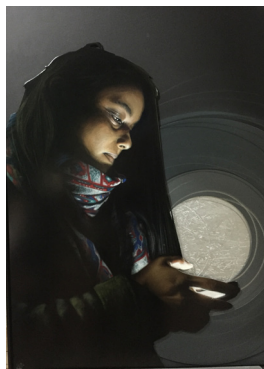
Contact , 2018 Bombe de peinture et acrylique sur bois et médium. 160 x 120 cm 3 500 euros