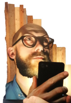
Zone Blanche , 2019 Bois, plexiglass, bombe de peinture sur médium. 215 x 150 x 75 cm 8 000 euros