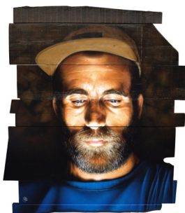
Notifications , 2018 Bombe de peinture sur bois. 160 x 130 cm 3 200 euros