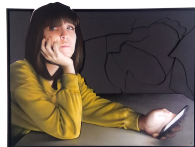
News Feed , 2019 Acrylique et bombe de peinture sur bois et médium. 122 x 155 cm 3 800 euros